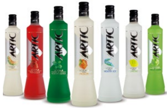
1000 ML. LIMONE, FRAGOLA, MELONE, MENTA VERDE, PESCA, MENTA ICE, MELA VERDE 700 ML. LIMONE, FRAGOLA, MELONE, MENTA VERDE, PESCA, MENTA ICE, MELA VERDE