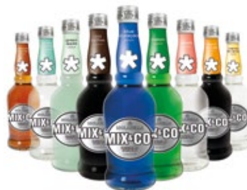
700 ML. OLD COFFEE, MELON, GREEN APPLE, BRAND ORANGE, PEACH, BLUE CURAÇAO, CREMA DI MENTA BIANCA, APRICOT BRANDY, CREME DE CACAO