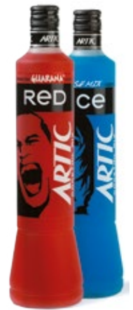
700 ML. ARTIC MIX RED ARTIC MIX ICE