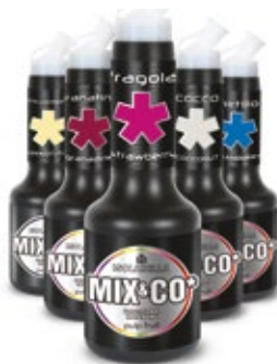
950 ML. FRAGOLA, COCCO, GRANATINA, CRAMBERRY PASSION FRUIT