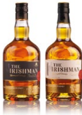
700 ML WHISKEY FOUNDER'S RE SERVE WHISKEY SINGLE MALT