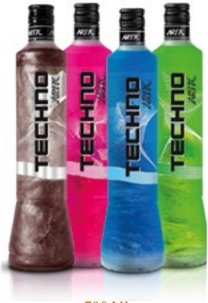
700 ML. TECHNO COLA, TECHNO RED TECHNO BLUE, TECHNO GREEN