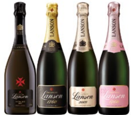
750 ML. EXTRA AGE GOLD LABEL BLACK LABEL ROSE LABEL