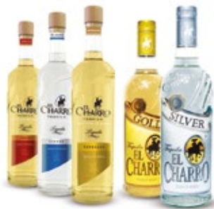
1000 ML. EL CHARRO SILVER, EL CHARRO GOLD